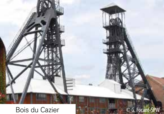
Bois du Cazier